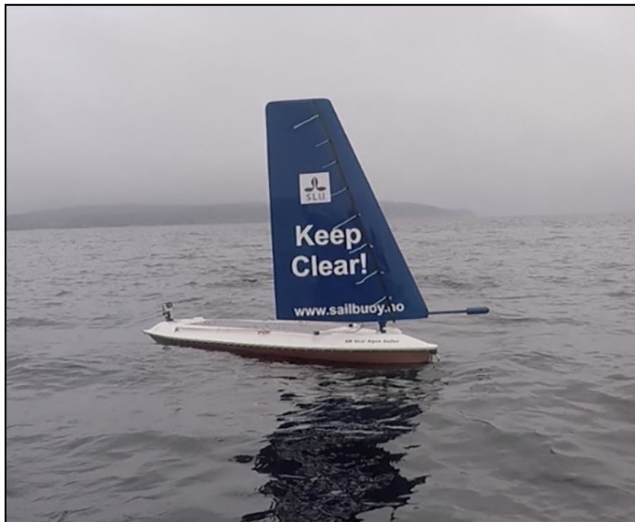
Bild av segelbojen